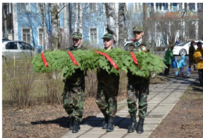
Рис. 6. Возложение гирлянды

Специально к праздничному мероприятию студенты техникума подготовили и вручили ветеранам памятные подарки, созданные своими руками, и цветы (рис. 6).