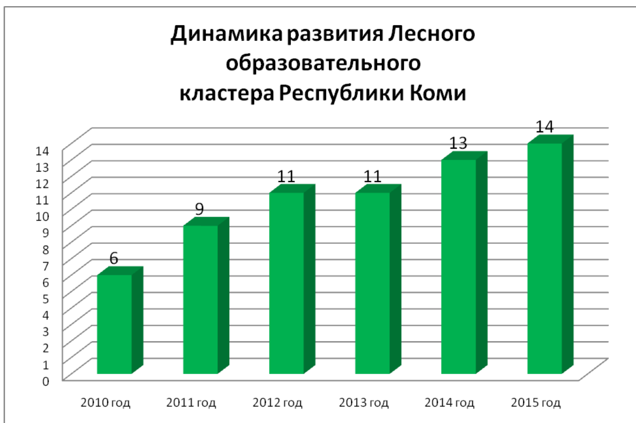
Рис. 1. Динамика участников Лесного образовательного кластера Республики Коми

Динамика состава участников Лесного образовательного кластера Республики Коми представлена на рис. 1.