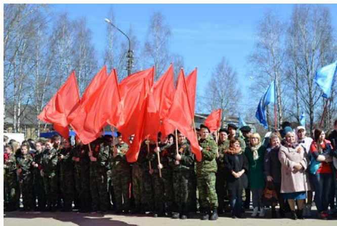
Рис. 4. Старт автопробега в Сыктывкаре

Пробег стартовал в Сыктывкаре (рис. 4) после митинга и возложения цветов у Вечного огня. Маршрут участников пролегал через Выльгорт, где также состоялся торжественный митинг с участием ветеранов Великой Отечественной войны (рис. 5), руководства района, учащихся двух выльгортских школ, студентов агропромышленного техникума и воспитанников детского сада № 8.